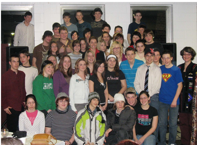
BAS DE VIGNETTE, PHOTO «08-02-27 poésie 2 -x» L'ensemble des participants à la soirée poésie.