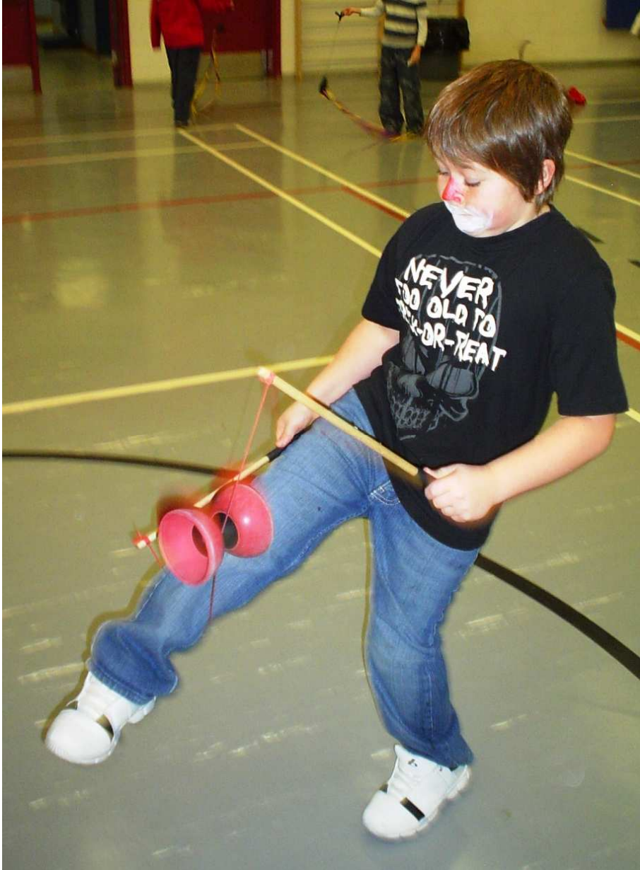
BAS DE VIGNETTE, PHOTO «cirque 16» Démonstration de diabolo.