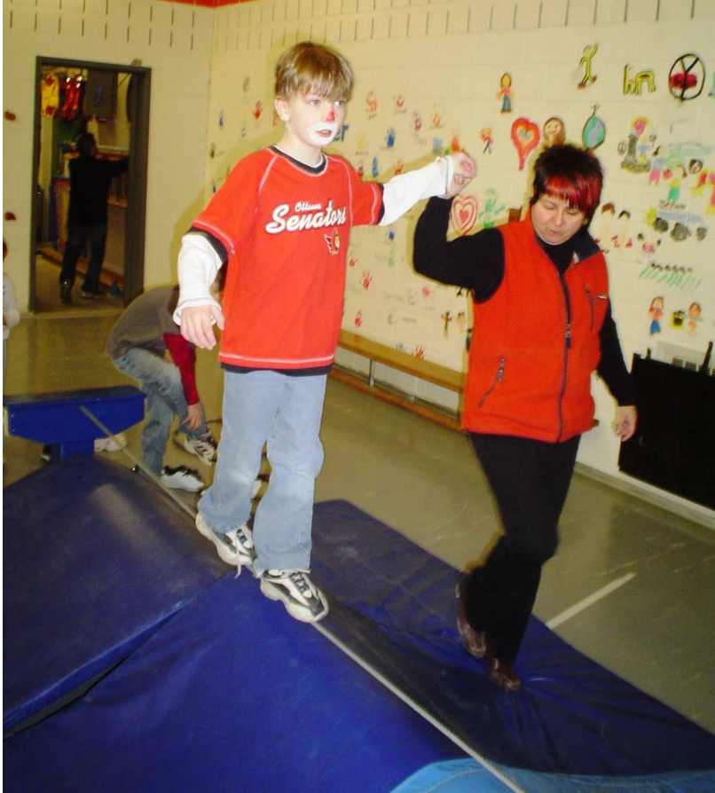
BAS DE VIGNETTE, PHOTO «cirque 20» Marche sur un fil de fer.