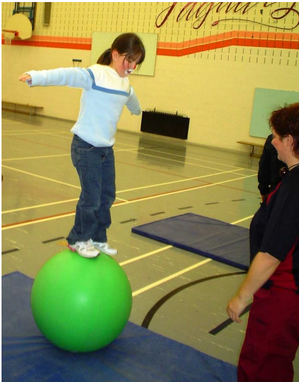
BAS DE VIGNETTE, PHOTO «cirque 06»

Plusieurs autres exercices avaient lieu au gymnase : ici, la marche sur un ballon.