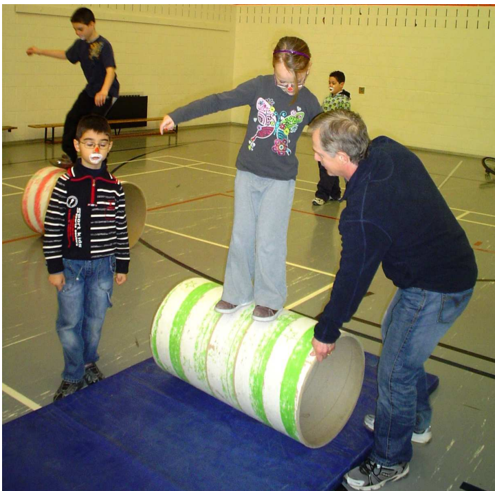
BAS DE VIGNETTE, PHOTO «cirque 09»

Plusieurs autres exercices avaient lieu au gymnase : ici, la marche sur un ballon.