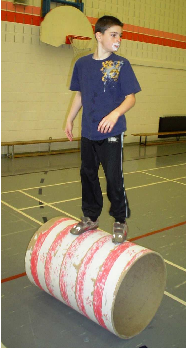
BAS DE VIGNETTE, PHOTO «cirque 11» Il faut beaucoup de coordination pour rester debout.