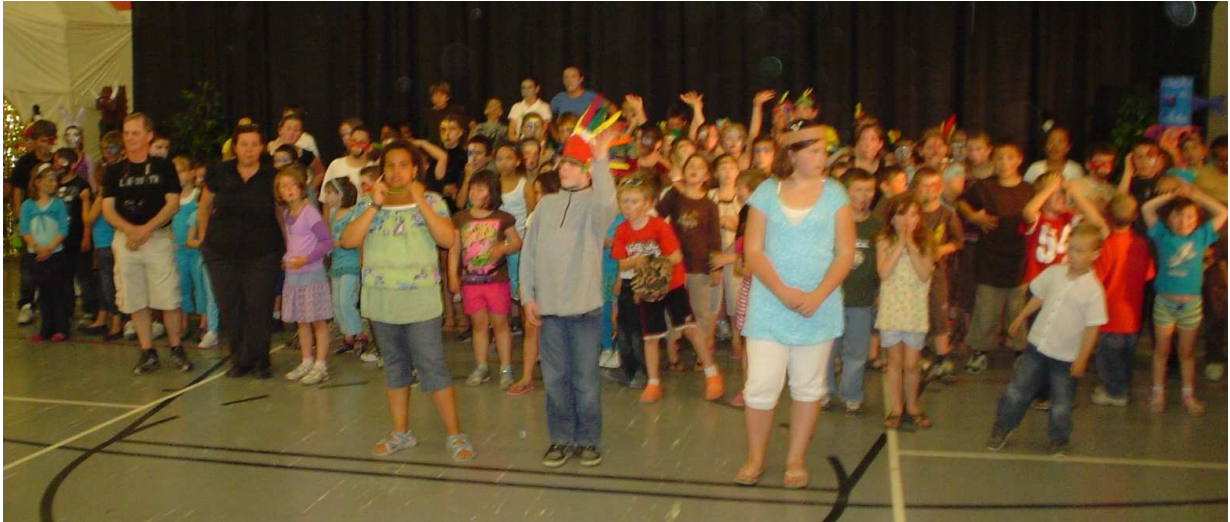
L'ensemble des élèves et des enseignants impliqués.