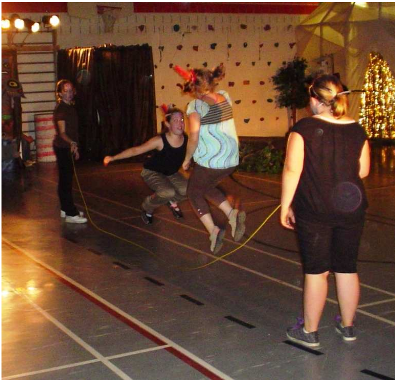
À un certain moment, une jeune fille sautait à la corde à l'intérieur de la corde actionnée par deux autres élèves.