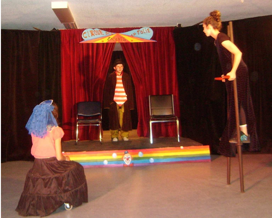
BAS DE VIGNETTE, PHOTO «cirque lsm 2» Beaucoup de succès pour ce spectacle.