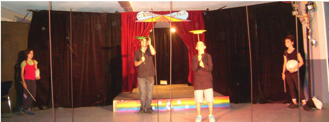
BAS DE VIGNETTE, PHOTO «cirque lsm 5» Des élèves qui ont du talent.