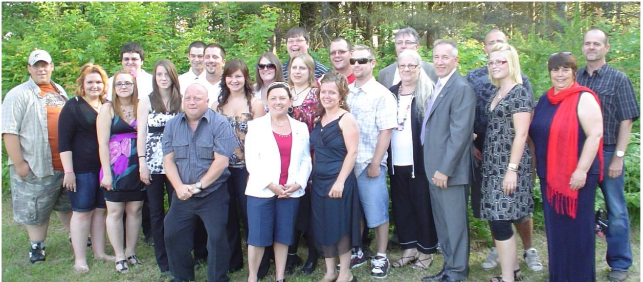
L'ensemble des élèves et des dignitaires.